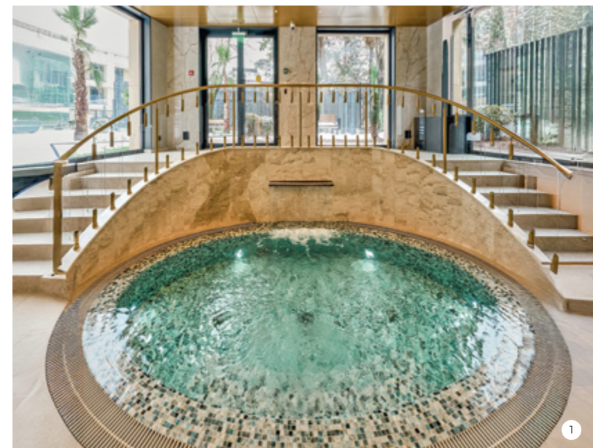
1-2. На проекте основные работы с материалами МАПЕИ велись по строительству SPA-зоны и хаммама.

Подобрать материалы для строительства плавательного бассейна и SPA-зоны от подготовки основания, гидроизоляции до облицовки поверхности.