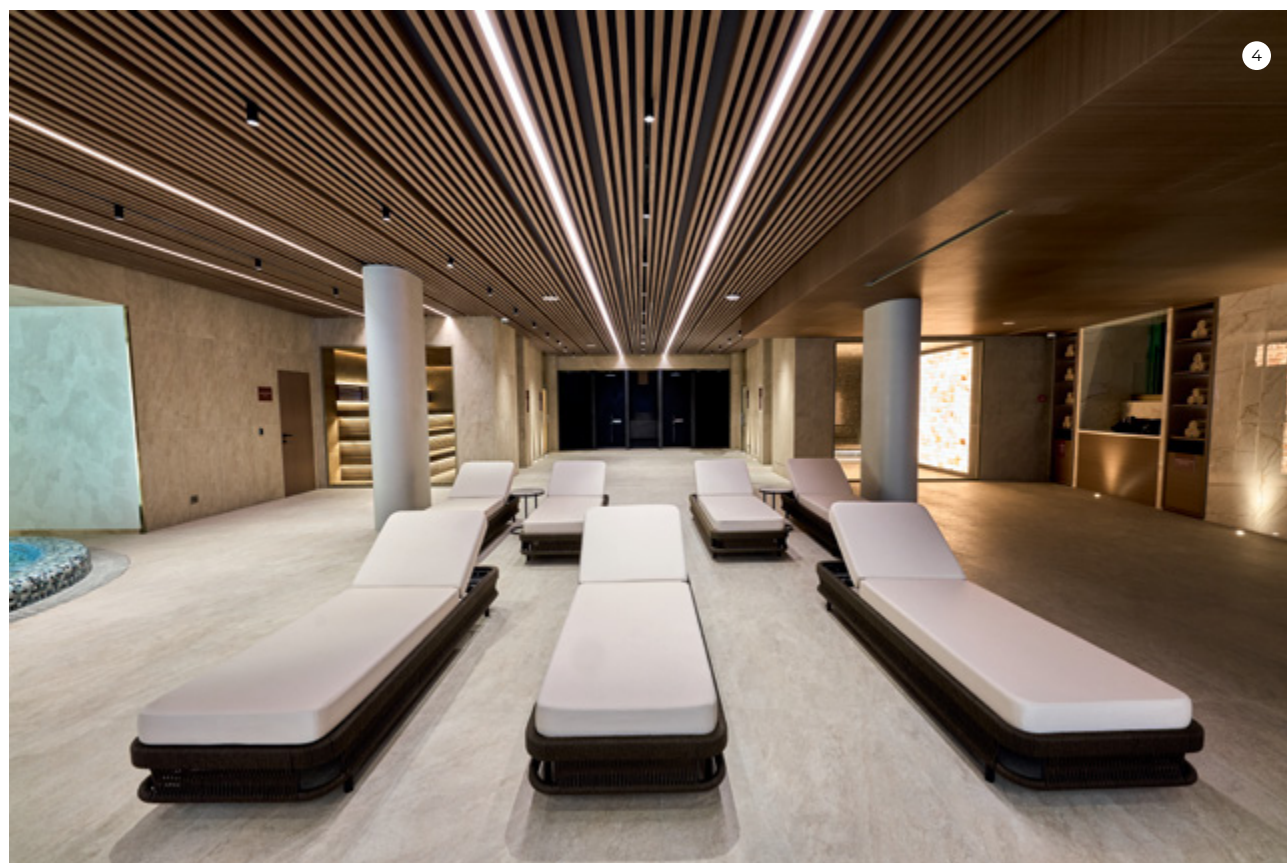
3-7. Решение МАПЕИ от подготовки основания до облицовочных работ применялось при строительстве «мокрой зоны» отеля.